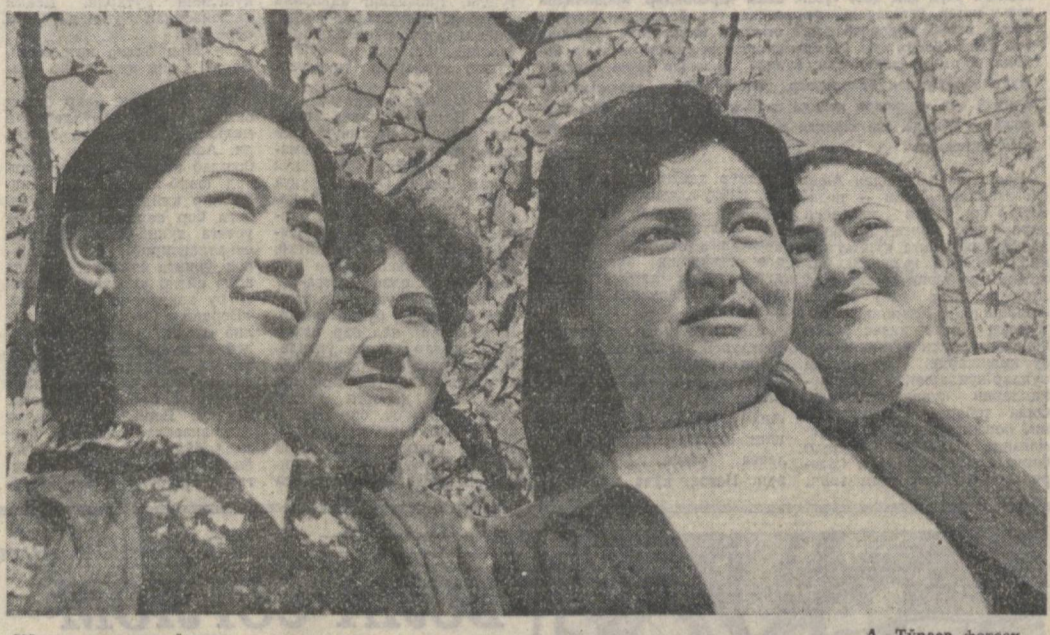
Кўклам тароват Узага.

К УВОНЧЛАРДАН қудратлироқ, ҳаётовардир. Улу доҳимиз В. И. Ленин шунинг учун халқ сайларини севади, уларда бақонидил қатнашарди. Халқ сайларида инсоннинг эҳтиши хусусиятлари ва, айниқса, инқилобдорлиги — ўйини, кўшини, хайратини, қўлларини, эртанликда билан намоян бўлади. Қўнглик ўрғанида у олижаноб ҳислар орттиради. Инсонлик шоншарофати ҳақида уилади.