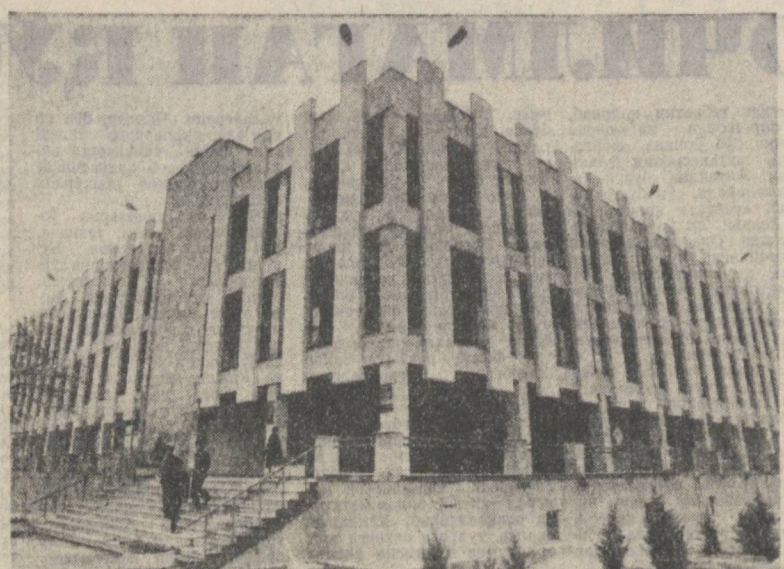
Серкўб республиканинг иқтисодий ва хўжалиқ ҳаётига барча соҳаларига Ўзбекистон фанининг таъсири йил сайин ошиб бормоқда. Олимларимиз фундаментал ва амалий тадқиқотлар бўйича сезиларли ютуқларни қўлга киритдилар. Фанда илмий изланиш учун, энг муқим замоний ва долзарб проблемаларни муваффақиятли ишлаб чиқиш учун

Совет, қишлоқ хўжалиғи ва суғ' хўжалиғи органлари, комсомол ташкилотларининг ҳозирги вазиқлари маккажўхорини гош қисқа муддатда экиб олиш учун зарур ҳамма чораларни кўришдан иборатдир. Партия ташкилотлари назоратни қийаитиришлари, маккажўхори экин топиқрини сўзсиз бажаришлари, дон энг ахши агротехника муддатларда экилиб бўлмоғи учун қадарлаб талабчанликни оширишлари керак.