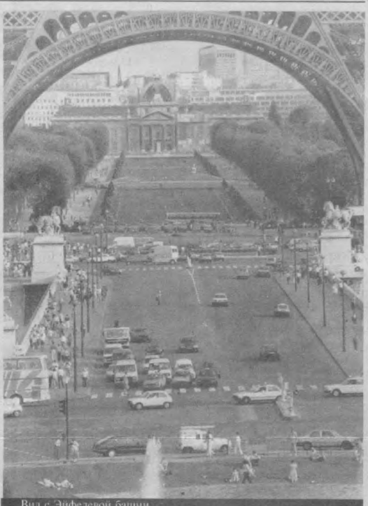
Вид с Эйфелевой башни.