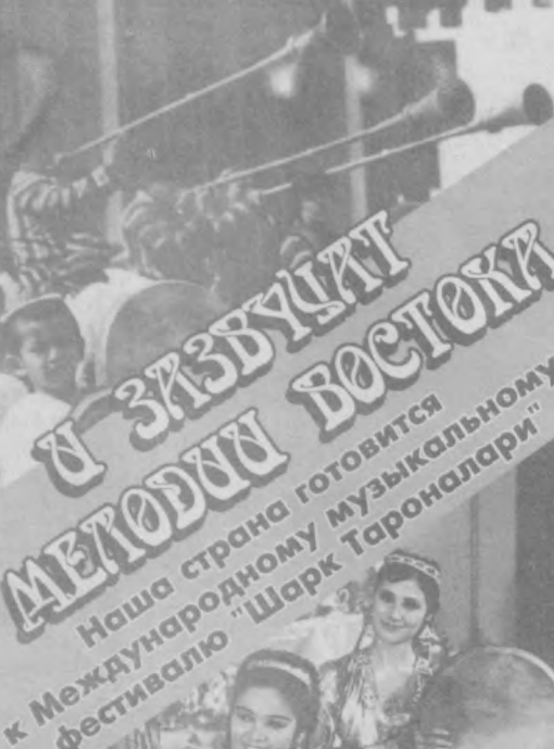
В зыбучей песне, в прикладном, изобразительном искусстве, в искусстве миниатюры, в ремесленничестве и так далее. Это имеет огромное значение в выражении его самобытности в сообществе народов мира.

За годы независимости в Самарканде так же, как и в Ташкенте, осуществлена огромная созидательная работа. В частности, в связи с юбилеями Мирзо Улугбека и Амира Темура