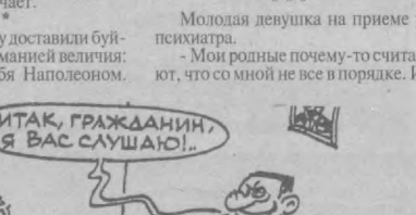
Рис. Вячеслава Капрельянца.