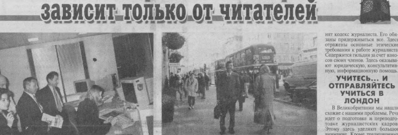
По инициативе посольства Великобритании в Узбекистане и по приглашению правительства этой страны небольшая группа журналистов Узбекистана получила возможность познакомиться с деятельностью средств массовой информации "Туманного Альбиона".