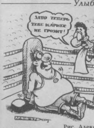
Рис. Александра Маркелова.

Пожоже, тема русской мафии становится весьма расхожей и американском кинематографе.