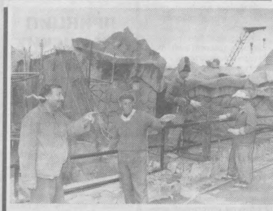
Человек отвечает за все живущее на Земле. Этот закон стал основой проектирования уникального даже по мировым меркам нового Ташкентского зоопарка.

Туполангское водохранилище и гидроэлектростанция на нем - крупнейшие стройки юга Узбекистана. Подразделение "Туполанггидрострой" подняли плотину хранилища выше ста метров, что позволяет увеличивать накопление воды в рукотворном резервуаре.