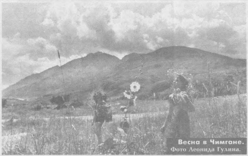
Весна в Чимгане.