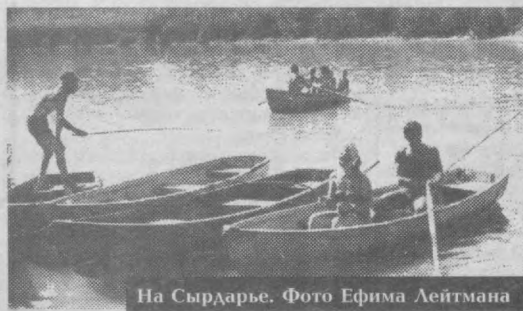
На Сырдарье.