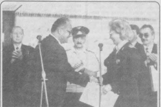
Репортаж в номер

Ислам Каримов, Президент Республики Узбекистан.