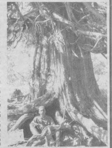
особенно на высокой ультраультрадиолетовой радиации в альпийском поясе, что значительно удлиняет жизненный цикл этих долгожителей - свидетелей седой старины.

Высоко в горах, где, кстати, растет и арча, древственные породы обладают высокой экологической валентностью, биологической пластичностью, физической выносливостью к суровым климатическим условиям.