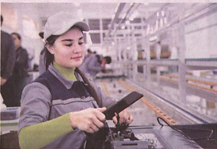
“Biss electronics system” МЧЖ томонидан тайёрлана бошланган плазма экранли телевизорлар аҳоли эҳтиёжларига мослиги, ҳамёнбоплиги ва сифати билан ажралиб туради.

Президентимиз жойларда амалга оширилаётган бунёдкорлик ҳамда обо-донлаштириш ишлари, иқтисодий-иқтисодий ислохотларнинг бориши билан