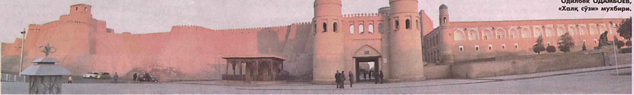
Одилбек ОДАМБОЕВ, «Халқ сўзи» мухбири.