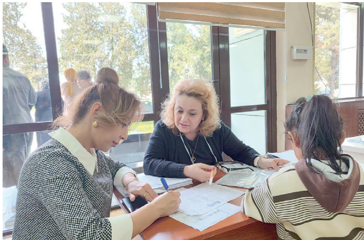
6 ёшдан 16 ёшгача бўлган алоҳида таълим олиш эҳтиёжлари мавжуд бўлган болалар учун ғамхўрлик гуруҳлари ташкил этиляпти.

Мақсадимиз юртимизда улғаяётган ҳар бир фарзанд имкониятидан келиб чиқиб билим олсин, атрофидошлари билан мулоқот қилсин, ўзининг ички имкониятларини тўла намоийш этсин. Уларнинг кулги, ҳаётдан рози бўлиб яшаши учун барча шарт-шароитлар бисёр.