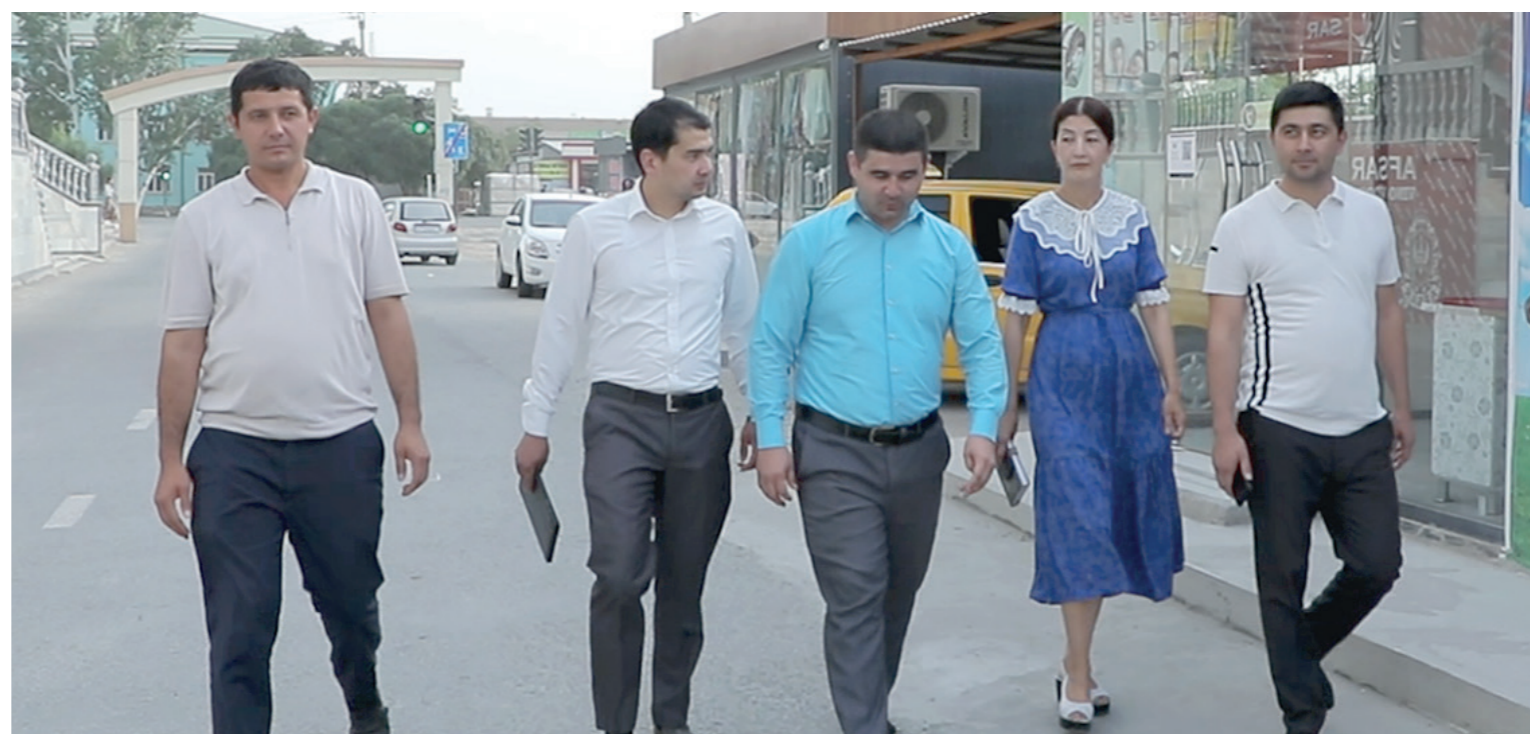
“Маҳалла еттилиги” билан ишлашимиз натижасида, январь-май ойларида 90,7 млн. сўм миқдориди қўшимча манба аниқланди.

Маҳалладаги дастлабки ишимни хуфйёна иқтисодиёт улушини маҳалла кесимида қисқартиришдан бошлаганман. Бу борада маҳаллага киравершиддаги 18 та кўчма дўкон эгалари билан бирма-бир суҳбатлашиб, уларга Вазирлар Маҳкамасининг 148-сонли қарори талабларидан келиб чиққан ҳолда фаолият юритишларида намуна бўлиши кераклиги тушунтирилган.