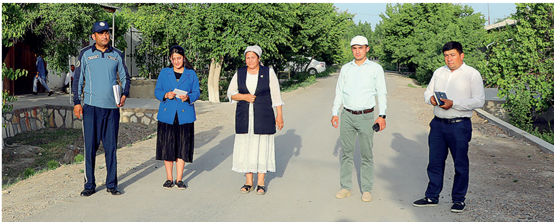
Фирибгарлик бўйича ҳар бир кўчада фуқаролар билан учрашувлар ташкил этиб, уларга ҳуқуқий маслаҳатлар бердик.

Тадбир жараёнида шахсий таркибга хизматни тизимли, масъулият ва ҳушёрлик билан ташкил этиши, аниқланган камчиликларни бартараф қилиш юзасидан тегишли топшириқлар берилди ҳамда ижроси назоратга олинди. Ишчи гуруҳ аъзоларининг тунги хавфсизлик чораларини ўрганиш ишлари бошқа туманларда ҳам давом этмоқда.