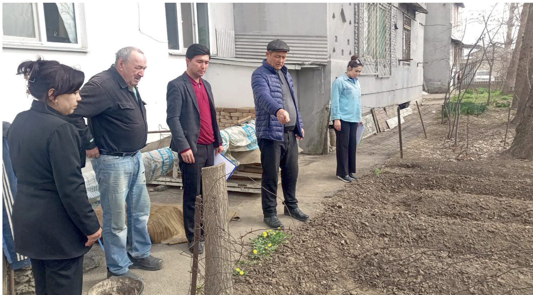
Уйма-уй юриб, одамлар билан дилдан суҳбатлашиб, уларни қийнаётган муаммоларга бирга ечим изляялмиз.

Агентлик аҳолини ижтимоий ҳимоя қилиш ва ижтимоий хизматлар кўрсатиш соҳасидаги ягона давлат сиёсатини ишлаб чиқиш ва амалга ошириш бўйича ваколатли давлат органи сифатида жамиятда болаларга нисбатан таъбиқ ва зўравонлик ҳолатларининг ҳар қандай кўринишига қарши курашиш юзасидан амалий тадбирларни давом эттирди.