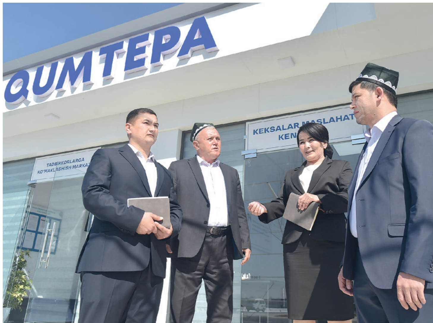
МАҲАЛЛА: КЕЧА ВА БУГУН

Маҳалла — узок ўтмиш, маҳалла — бутун, маҳалла — келажак. Бу кўҳна халқа асрлар давомида халқимиз ҳаётининг мазмунини аниқлаб беришга қолмай, кадриятлар, инсоний муносабатлар, орзу ва мақсадлар асоси бўлиб келган. Ота-боболаримиз маҳаллага эш бўлиб, эл дардини ашлаб ўтган, бутун биз шуну муҳитда яшаб, фарзандларимизни юртга қўшим, эл қорига камарбаста қилиш шиятдамиз.