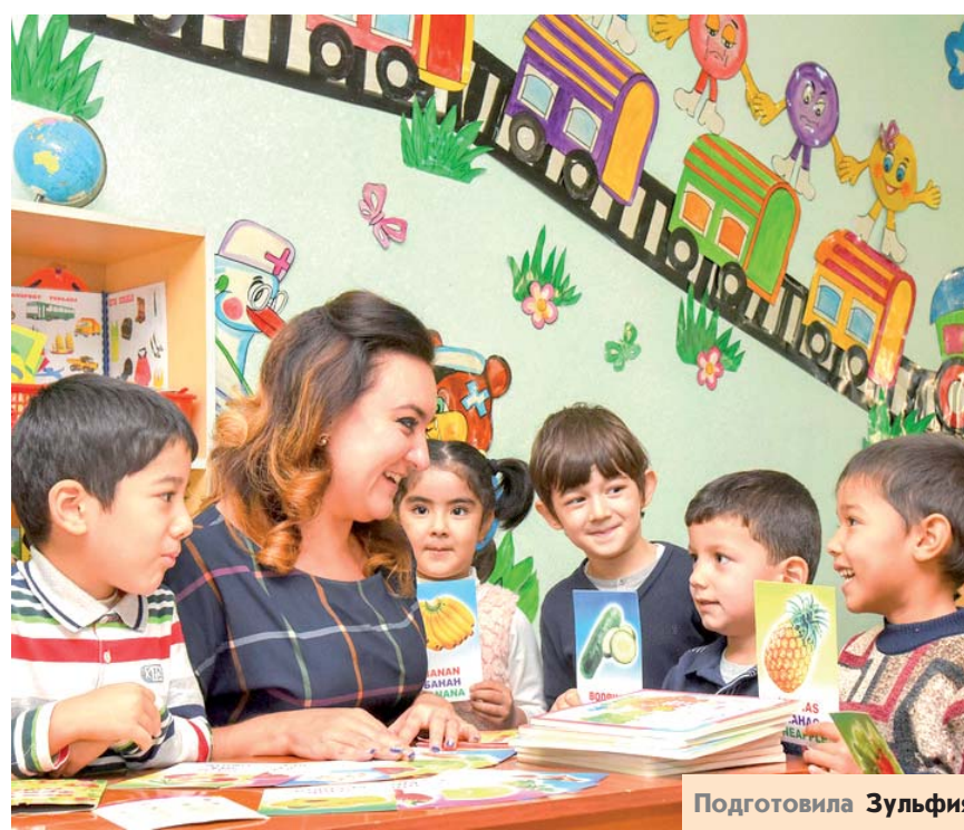
Подготовила Зульфия ИБРАГИМОВА, «Народное слово».

Столичный хокимият представил перечень государственных детских садов, в которых нет очереди. В эти ДОО дети принимаются из любого района Ташкента.