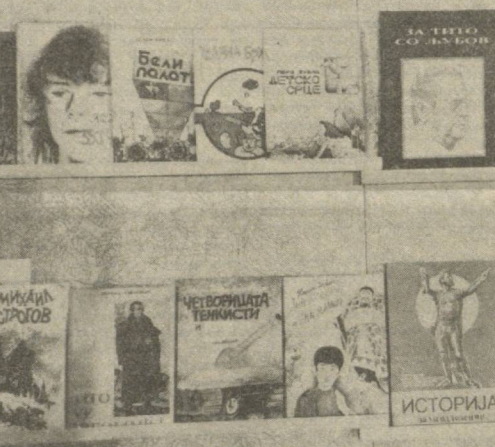
Ўзбекистон Рассомлар союзининг Қўрғазмазар залида Македония икитоблари кўрғазмаси намойиш этилмоқда. СУРАТДА: Македония нашриётларида чоп этилган ва кўрғазмадан жой олган икитоблардан намуналар.

Табиий офатлар ичиде йирик шаҳарларга катта тутор етказилган — эндилик, — дейди олим. — Тошкентнинг ҳам, Скопьеининг ҳам бошига бу кулфат тушган ва шу маънода ҳар иккала шаҳарни қисматдор, дейишди. Азалдан ота-боболаримиз: Дўст оғир кунда синалади, деб бекиб айтиш-