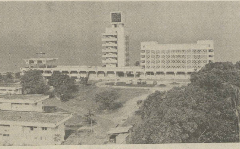
Ганиев пойтахти Комакда А фрина қитъасида энг йирик илмий тадқиқотлар маркази очилди. Бу марказ Совет Иттифоқи ердамида барпо этилди. Марказда қатор илмий масалалар ҳал этилади. Суратда: марказнинг кўриниши.