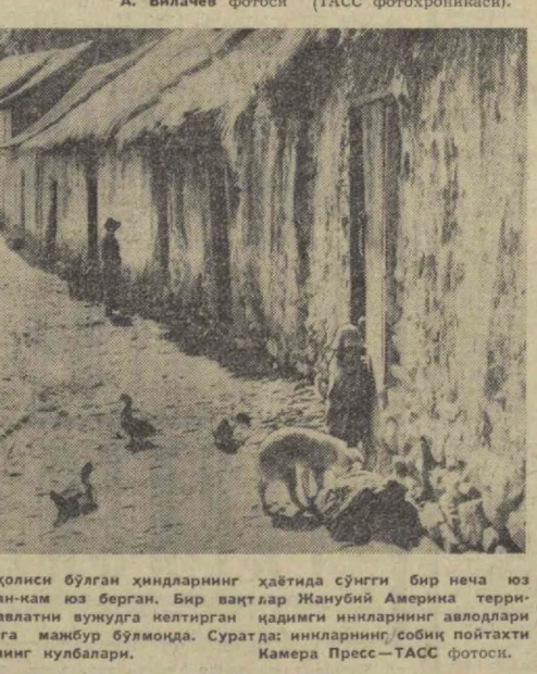
Перу. Мамлакатнинг туб аҳолиси бўлган хиндларнинг ҳаётида сўнгги бир неча юз йил ичида ўзгариш жуда камдан-кам юз берган. Бир вақтлар Жанубий Америка территориясида юксак маданиятга эга бўлиб келтирилган ҳозир ҳароба қулбаларда яшаган мажбур бўлимоқда. Суратда: инкларнинг соқиб пойтахти Куско шаҳри четда хиндларнинг қулбалари.