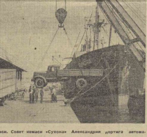
Бирлашган Араб Республикаси деб эълон қилинган «Сухона» Александрия портига автоматизация келтириди.

ПОЛЬША СЕЙМИДА Варшавада Польша Халқ Республикаси Сеймининг мажлиси очилди. Польша Халқ Республикаси Министрлар Совети ҳузуридаги планлаштириш комиссиясининг раиси Стефан