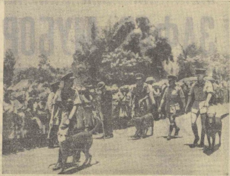
Жанубий Родезия. Солсбери шаҳри кўчасидан ит отқилган полиция патрули ўтиб бормоқда.

Корея Халқ Демократик Республикасининг ҳукумати Япония—Жанубий Корея шартномаси пуч бир нарса ва уни Корея халқи тан олмайдиган, деб қатъий равишда уқитириб ўтди.