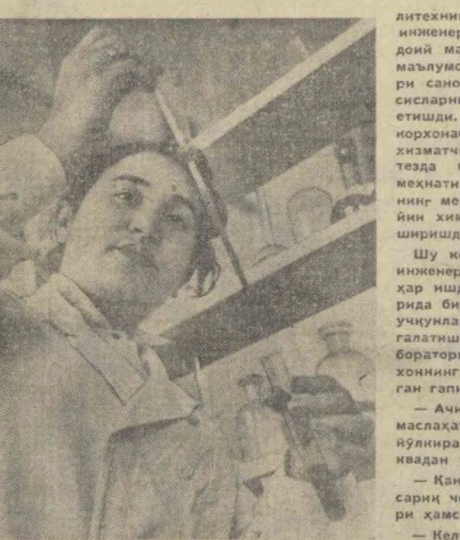
Кутбихон билан ўтирибман. Сут саноати хусусида суҳбатлашиб, ногўнхон болалигини кўрсатдим.

Бу ҳам ўтди. Ун-ун беш кун ўтган, Оқўрғондаги қабул қилиш пунктдан келган сутлар тоза эмаслиги аниқланди. Оқўрғон пункт комби-