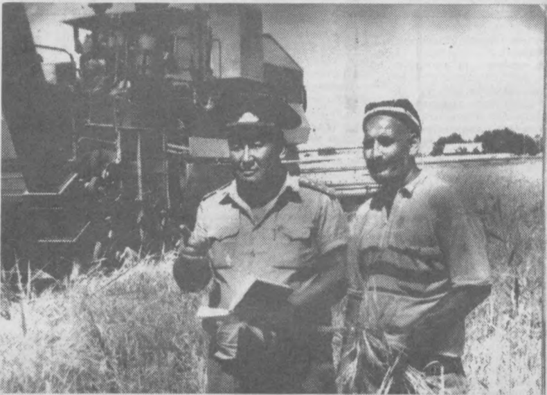
На полях акционерного общества закрытого типа имени Ш. Рашидова Касбского района выращен богатый урожай на 950 гектарах.