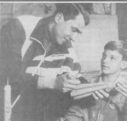
Мальчишки штурмуют небо

Первые тесты в ташкентских городских соревнованиях заняли его воспитанники - школьники