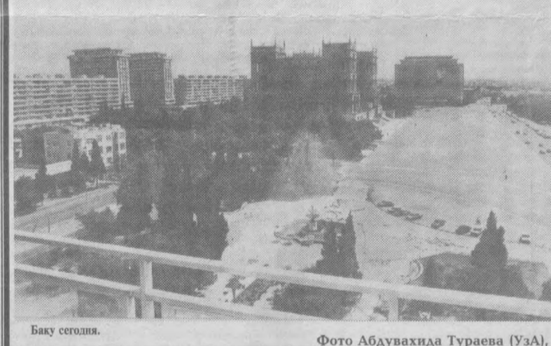
Баку сегодня.

В мае 1996 года Азербайджанскую Республику посетил с официальным визитом Президент Республики Узбекистан Ислам Каримов. В ходе визита было подписано 18 документов, среди которых соглашения о развитии и углублении двустороннего