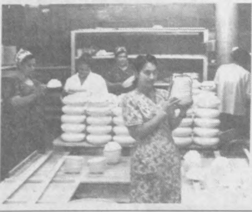
НА СНИМКЕ: в керамическом цехе.

Весомый вклад в празднование юбилея своего любимого города-сады вносит труженики акционерного общества "Хива сополи" ("Хивинская керамика"). Мастера известного в республике предприятия подготовили богатый ассортимент изысканных, оригинальных изделий из фарфора и керамики.