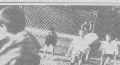
Удар, еще удар!

И женские команды неожиданно не преподнесли. Кубок Узбекистана вручен "Д-клуб-СКИФу". Эта команда в нынешнем сезоне завоевала себе все возможные титулы и награды: чемпион Узбекистана, обладатель Кубка Независимости. Из 12 игроков сборной восемь - представительницы "Д-клуб-СКИФа".