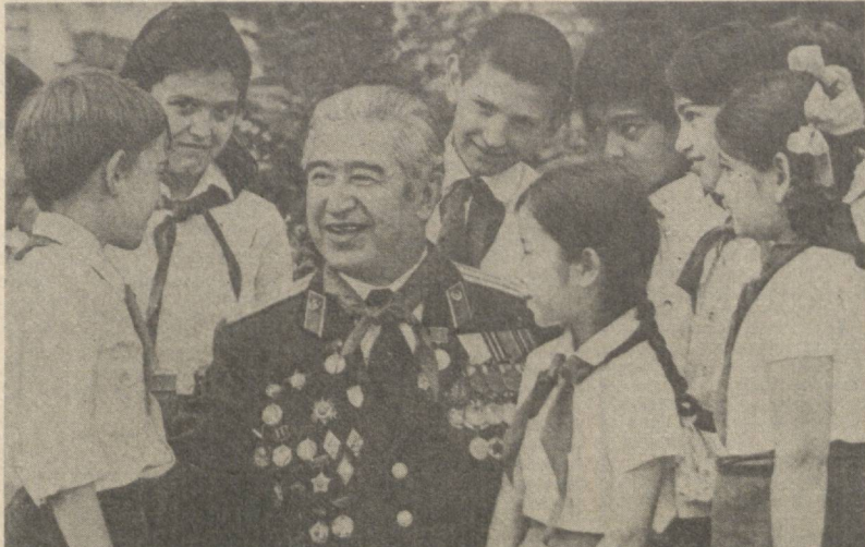
Совет халқи, бутун прогрессив инсоният шу кунларда Улуғ Ватан уруши тарихида ўчмас из қолдирган Курск жангининг 40 йиллигини нишонламоқда. Солдат ва офицерларнинг жанговарлиги қобилиятини оширишга юксак маънавий-сиёсий фазилатларга, ҳарбий иш соҳасида мутахассисликка эга бўлган советий ходимлар катта