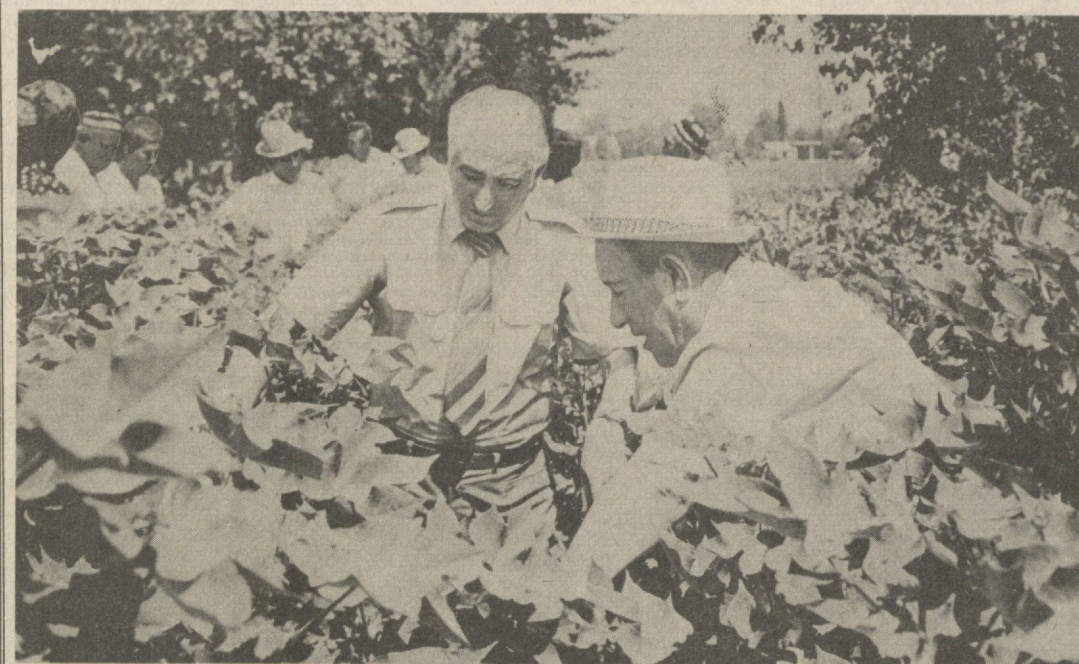
Мусобақадosh Озарбайжон пахтакорларининг бир гуруҳи Тошкент области, Янгийўл райони хўжаликларида

Ҳар бир меҳнат кишининг коммунистик турмуш тарзини қўриш ва такомиллаштириш иш билан қудратли турмуш умумий курашига салмоқли ҳисса қўлиши учун курашга руҳлантириш ривожланган коммунистик ҳар бир киши ва босқичнинг энг зарур ахтиёт ва таъкидларидандир. Ана шунга эришиш ва таъкид қилиш зарур бўлган ҳиссада кўпгина «XXVI сьезди қарорларида қай қилингани» деб, партия социал сиёсатининг ажралмас таркибий қисмлардан бўлиб, бундан қўзланган мақсад — совет кишиларининг фаровонлиги ва бахт-саодатининг.