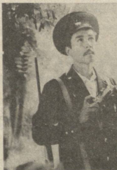
ТАБИАТ ВА ИНСОН

Уларнинг фидоқорона меҳнатлари туфайли қовуннинг қадимий машҳур андархон, ҳўнжикалла, гулоби, беҳзода, арioni ва қўлаб бошқа навлари қайта тикланди. Кўрғазма-конкурсда уруғчинос олимларимиз яратган ва тобора каттароқ майдонларда етиштирилаётган янги нав қовун-тарвузлар ҳам намойиш этилади.