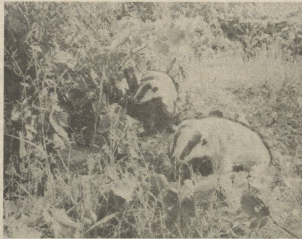
ТАБИАТ ВА ИНСОН

Хуллас, аравани музейга топширишга ҳали эрта. (ТАСС).