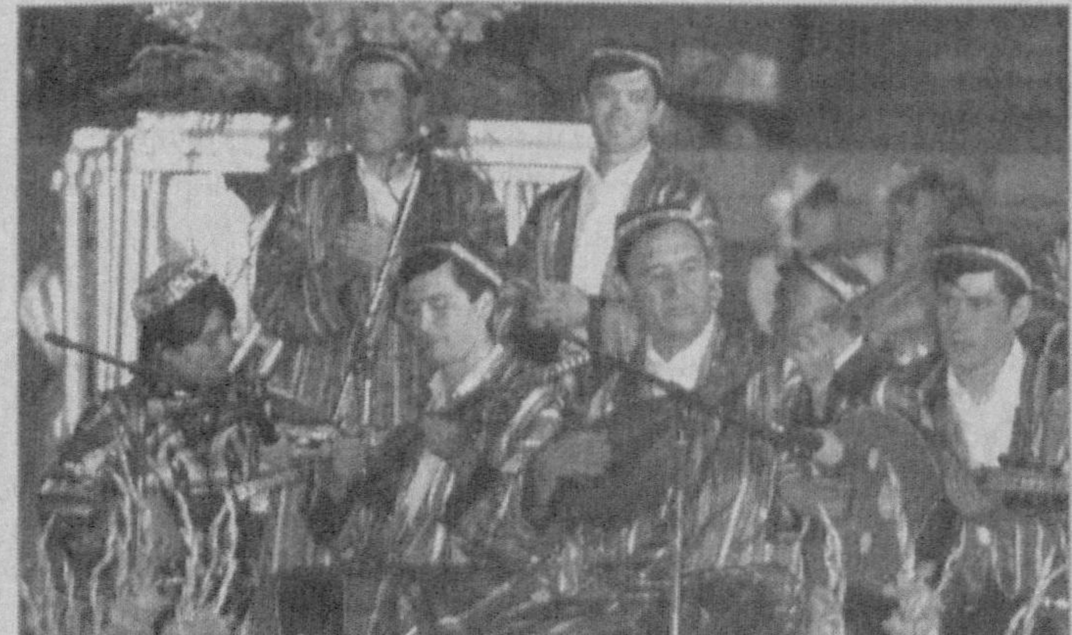
Ўзбекистон Республикаси Президенти И.КАРИМОВ Тошкент шаҳри, 2005 йил 22 август