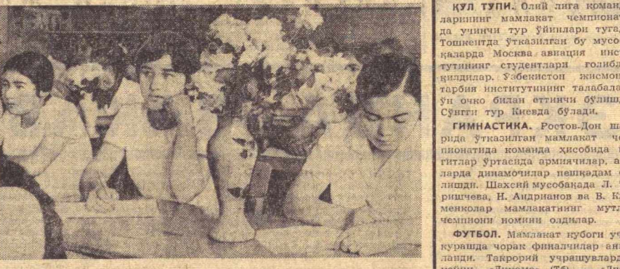
Республикаимиз мактабларида ёзги имтиҳонлар бошланди. Тошкентдаги 132-ўрта мактабда ҳам имтиҳон топшириш уюшқоқлик билан олиб бориляпти. Суратда: ўқувчилар она тилидан иншо ёзишмоқда.

Ер юзида буйи 120 сантиметрдан ҳам паст одамлар учрайди. Антропология тарихида буйи 102 сантиметрдан 38 сантиметргача бўлган ўн бешта пакана маълум.