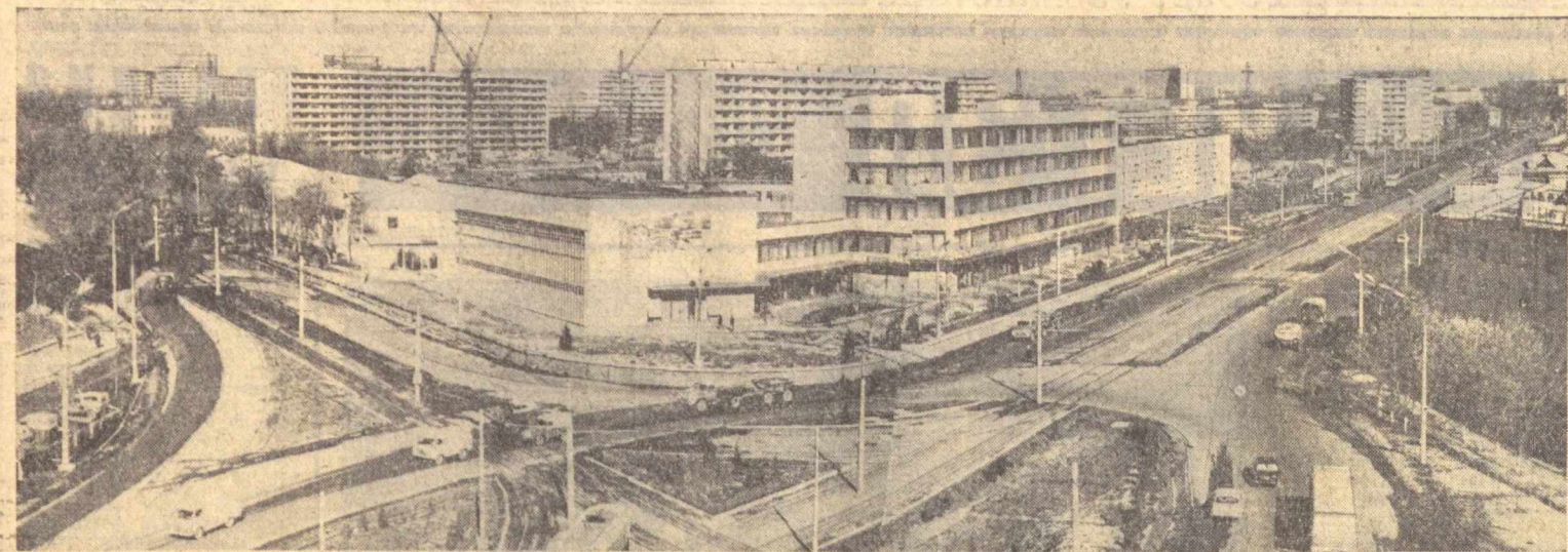
Тошкент шаҳри нундан-кунга кўркамлашиб бормоқда. Кенг кўчалар, кўп қаватли замонавий бинолар унинг кўрнгига кўрик қўшмоқда. Суратда: Саёрлар майдонининг умумий кўрinishи. Ибраҳимов Фотос, (3.7.74).

Иккинчи жаҳон урушида Днепротресск областада истиқомат қилувчи Иоганн Христаманович Швейгерт немис-фашист армиясига жалб қилинди. Уша вақтда Украина тупроғида босқинчилар вақтинча ҳуқуқдорлик қиларди. Тор-мор нелиридан титилчилар қўшинлари қатори у ҳам шармандаларча ченини, ГАРбий Германияда умрбоқ туриб қолди.