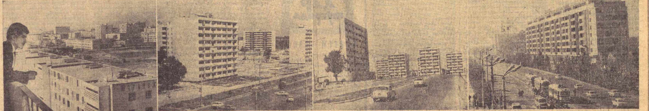
Суратларда: Ўзбекистон пойтахти — Тошкентнинг бугунги қиёфаси ва шаҳар макети.

Абдулла АБДУҚОДИРОВ, Абдуқарим НАБИХУЖАЕВ.