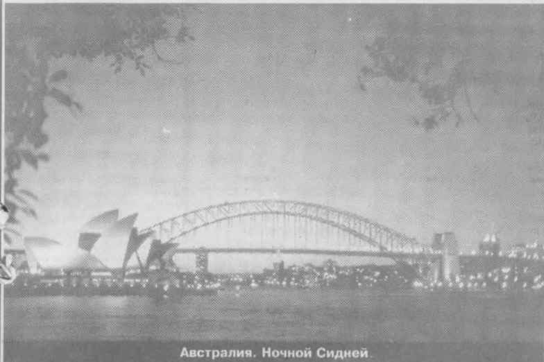
Австралия. Ночной Сидней.