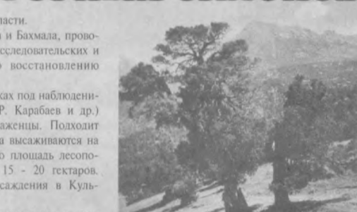
Уникальные арчовые леса, занимающие в Узбекистане более 190 тысяч гектаров, из-за сильного антропогенного воздействия (особенно нерегулируемого выпаса скота) значительно сокращаются.

В. Сахацкий. Кандидат сельскохозяйственных наук.