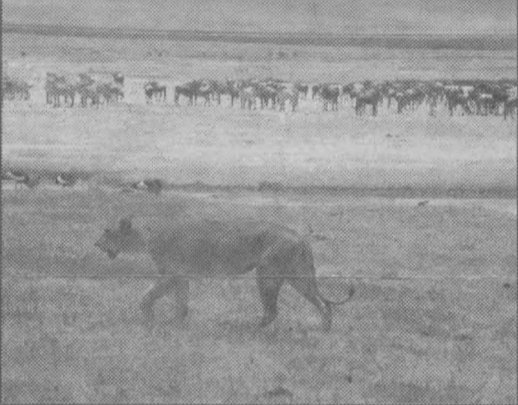
ФОТОЭТОДЫ ИЗ АФРИКАНСКОЙ САВАННЫ