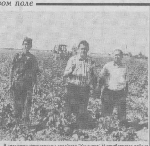
В дехканско-фермерском хозяйстве "Кунгирот" Музrabатского района закладывается прочная основа под хороший урожай хлопка-сырца.

Хорош хлопчатник на полях денауского колхоза "Хазарбаг". И настроение у дехкан хорошее: все уверены, что урожай нынче будет отменный.