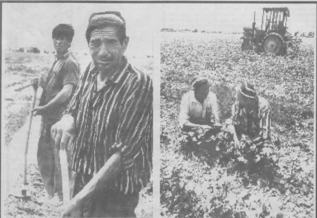
В этом году в Пахтайском районе хлопчатником заняты более 12 тысяч гектаров. Сейчас на полях работает около трехсот культиваторов. Четыреста поливальщиков приступили к подготовке полива растений. Лучшие всего хлопчатник развивается в хозяйствах "Навбахор", имени Шамис Назарова, "Зарфишон", "Октепа", "Дехконобод". Это достигнуто благодаря трудолюбию земледельцев и соблюдению ими правил агротехники.