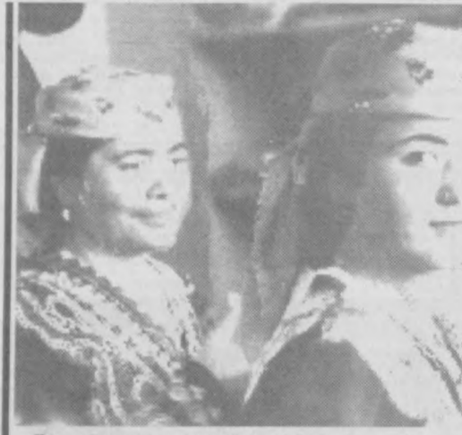
При арабском культурном центре, работающем в хозяйстве "Жеков" Усман-Юсуповского района...

Мир сказки - мир, где вечны Добро, Красота, Любовь Победители на Сурхандарьинском празднике песни