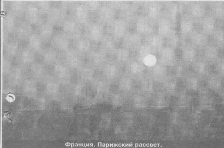
Франция. Парижский рассвет.