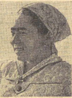
Чигитни энг яхши агротехника мудирида экиб олдик. Би...

Бир йилда ҳосилдорликни гектар бошига 15 центнер кўтаришимиз. Ҳар центнер пахта таянқилиш юзасидан қабул қилган социалистик мажбуриятимизни бажарамиз. Сув таъминлигини енгимиз. Ҳамма ҳосилини машиналарда териб оламиз. Чўққуварлик номини меҳнат билан оқлаймиз. Ўзбекистон ССР ва Ўзбекистон Компартиясининг олтин тўйини муносиб совғалар билан кутиб