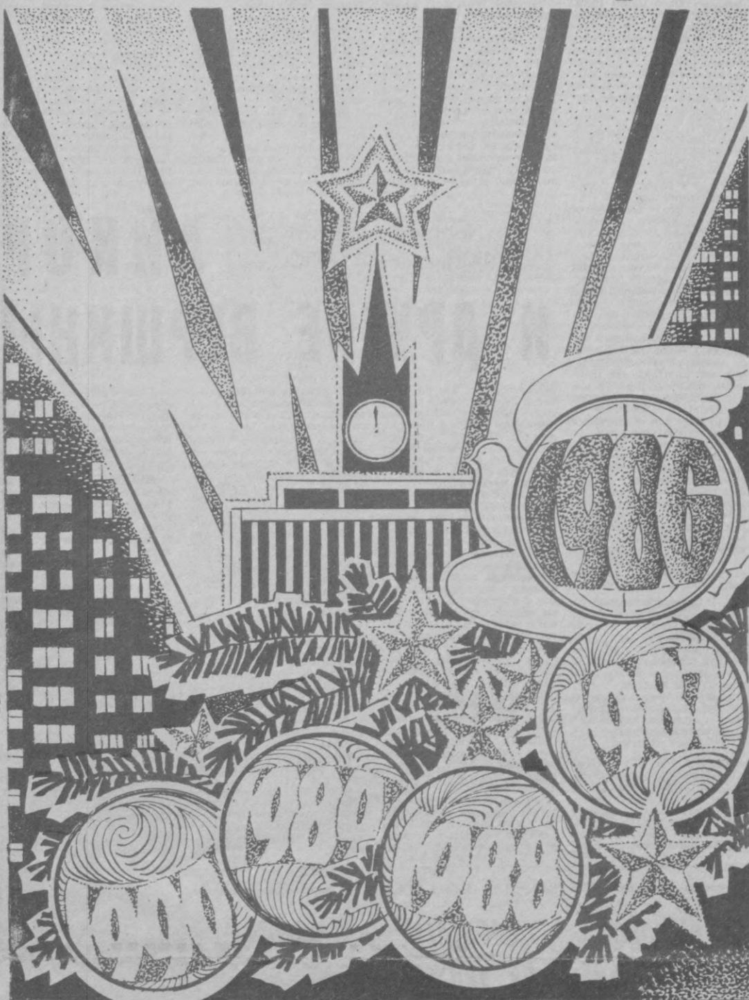
Плакаты народного художника Узбекистана В. ЕВЕНКО.