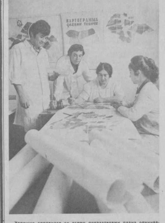
Успешно справился со всеми показателями плана единичной пятилетки коллектив Нахавандинской зональной картограммы. Сотрудники станции снабжают картограммами с подробными сведениями о состоянии конкретного участка почти 130 хозяйств области. За пятилетку объем работ в этом направлении возрос в полтора раза при той же численности коллектива. Достигнуто это за счет использования современного оборудования, а также в результате планомерных и программных принципов деятельности, четкой исполнительской дисциплины.

Э. ТОВСТОКОВ. Член КПСС с 1966 г. Ташкент.