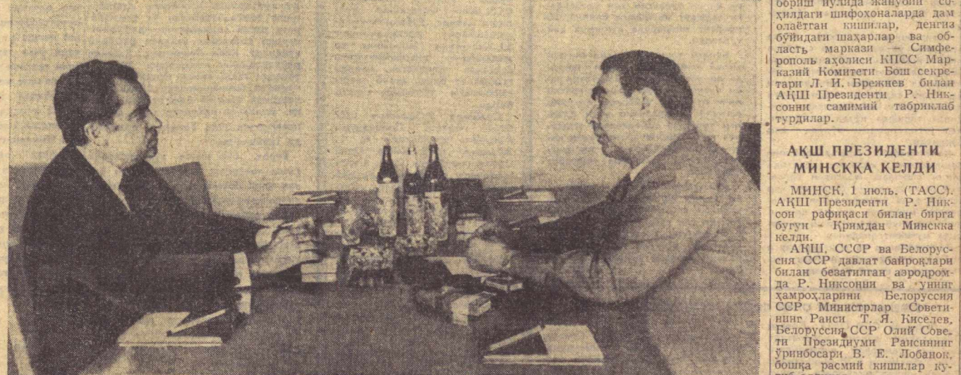
Сурагда: суҳбат пайти.

30 июнда Ореандада КПСС Марказий Комитети Бош секретари Л. И. Брежнев, СССР ташқи ишлар министри А. А. Громиконинг АҚШ Президенти Р. Никсон ва АҚШ давлат секретари Г. Киссинжер билан музокаралари давом эттирилди. Музокараларда: Совет томонидан — СССРнинг АҚШдаги элчиси А. Ф. Добрилин, КПСС Марказий Комитети Бош секретарининг ердмчиси А. М. Александров, СССР Ташқи ишлар министрлиги коллегиясининг аъзоси Г. М. Корниенко; Украина томонидан — АҚШ Президетининг ердмчиси А. Хейг, президентининг илғий хавфсизлик масалалари билан шўғуланувчи ердмчисининг уринбосари В. Скауэрфорт, давлат департаментининг маслаҳатчиси Х. Солценфельд қатнашдилар. Шу кунди КПСС Марказий Комитети Бош секретари Л. И. Брежнев АҚШ Президенти Р. Никсон шарафига зиёфат берди. (ТАСС).