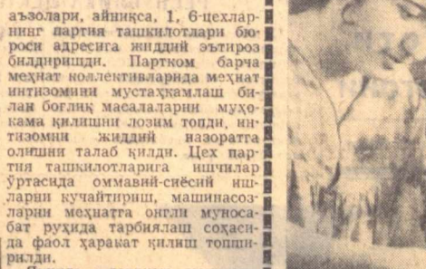
Ушунингдек, бюро мажлисида Худойбердиев номли совхоз ва «Правда» колхози бошланғич ташкилотларининг...