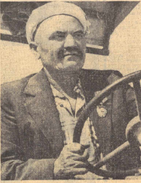
Бухоро вилояти Бобинент районидagi Калинин номидаги колхоз галлеролари тўғрисидаги ишчи йилнинг тўртинчи белгиланиши

Ўзбекистон ССР Маориф, Министрлиги мактабга ва мактаб ўшидаги болаларни ҳар томонлама бадий-эстетик тарбиялаш ривожлантиришга доир кўриштирилган ишлар, шу ҳақда аналитик ҳисоб-ҳисоблар, шунингдек, Ўзбекистон ССР Маданият, Маориф, Олий ва ўрта махсус таълим, Министрликларнинг, жиддий союзлар ва ташкилотлар билан ўз-ўзарининг аниқлашувчи вазифаларидан бири, деб ҳисоблайдилар.