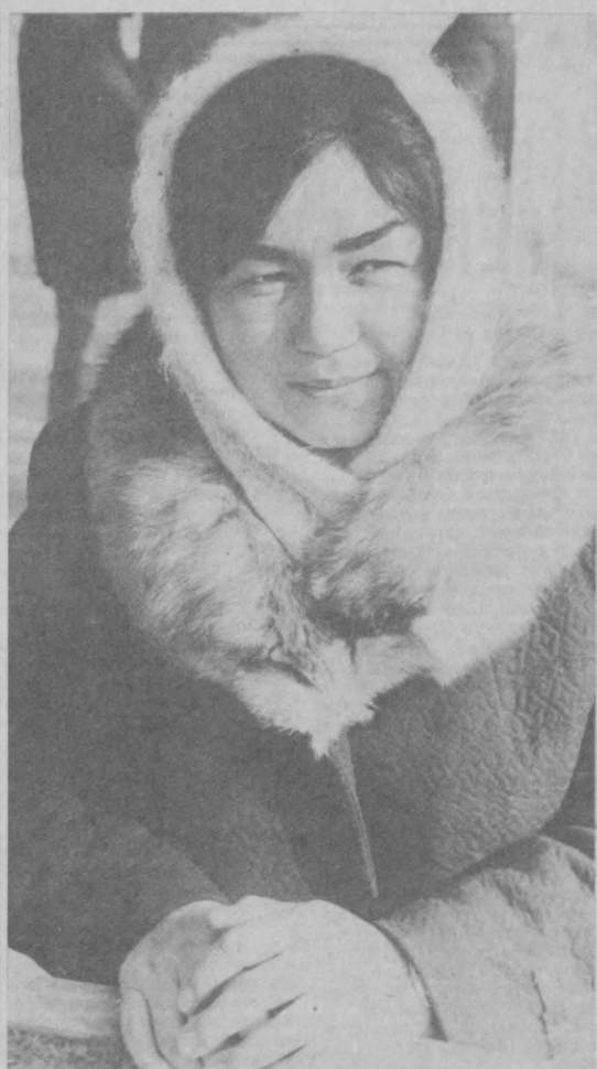
Делегат XXI съезда Компартии Узбекистана