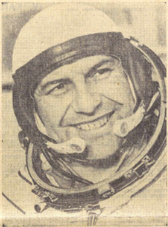
Павел Романович ПОПОВИЧ

● «САЛЮТ-3» СТАНЦИЯСИ АВТОМАТИК РЕЖИМДА УЧИШНИ ДАВОМ ЭТТИРМОҚДА.