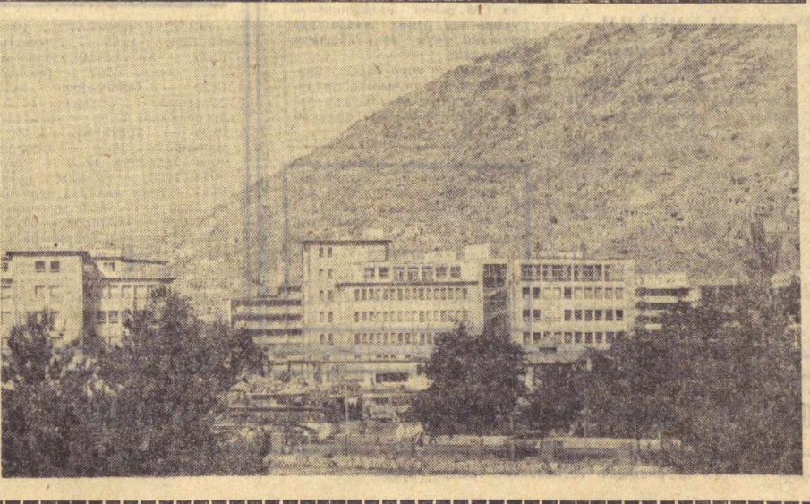
Афғонистон пойтахти — Ко-булининг кичаси ўзгариб бори-пти. СССРнинг ёрдами билан Ко-булда уй-юзликни комбинаи қури-лди. Шаҳарда янги минорайонлар вужудга келди. Сувайда Кобул-нинг янги уй-ўқой масъаси.

ПЕКИН. (ТАСС). Хитой газеталарини Кипрдаги во-қеалар ҳусусида шу пайтгача лом-ким демайтир. Икки ой олдин архиепископ Манарис Пенинда расмий визит билан қабул қилган ва уни дўстлиқ қўллаб-қувватлашга ваъда берган Хитой раҳбарлари ҳозирги кунда Кипр фойжасини ҳақида биронта гап айтганларига йўқ. Президент Макариоснинг барча дўст мамлакатларга мурожаат қилиб, Кипр халқининг Греция диктатурасига бўйсунишга қар-шин, мустақиллик ва демокра-тия ҳуқуқларини учин олиб бора-ётган курашини қўллаб-қувват-лаш ҳақидаги даъватига Хитой Халқ Республикаси жаъоб бер-гани йўқ.