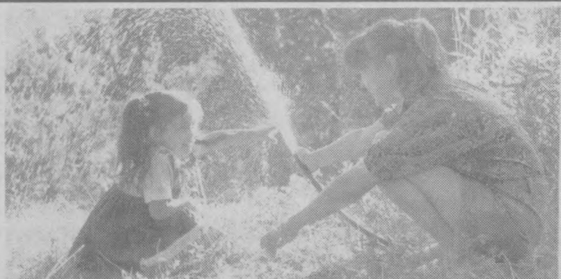
Смотрите! Как-будто бы фонтанчик...