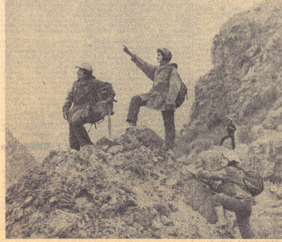
Фарғона областининг тоғлик районидagi «Избосар» болалар туристик лагерини ўқувчиларнинг сезиланманлигига айланган. Бу йилги мавсумда қариб 600 дан зиёд ўғил-қизларнинг лагерга қўйнида дам олиши кўзда тутилган. Суратда: бир гуруҳ ўғиллар кўп кунлик сафар чоғида.

ЛОНДОН, 5 август. (ТАСС). Журналист Дэвид Тендлер Тош-кент, Бухоро ва Самарқандни томоша қилгандан кейин Англия журнали саҳифаларида бо-силган мақоласида Ўзбекистон-ни қувноқ кишилар яшаётган ажойиб меҳмондўст ўлка деб атади. У Совет республикасига са-фарини тўғрисида ҳикоя қилиб, гузаб Тошкентнинг мафтуни бўлганлигини ёзади. Тошкент «1966 йилги эъланлардан кейин бутун Совет Иттифидан кел-ган бинокорларнинг ёрдами билан ҳаёқатан ҳам янгидан қу-рилди». «Бинокорлар кўни ўз-бет ҳаёқатининг традицион услу-биди янгилик руҳда қурилган бўлса ҳам, лекин замонавий би-нокорлар» деб ёзади Тендлер. У Самарқанд «тарихий ётқор-ликларга гоат бой ва жуда ян-гилик шаҳардир», деб ёзади ва «Самарқанддаги қадимий бино-лар замонар ўтиб қалн ҳам ўзининг гузаллиги ва улутвор-лигини йўқотган эмас», шаҳар маъмурлари бу бинокорларни авайлаб сақлашга эътибор бермоқдалар, деб таъкидлайди. Мақоласида Ўзбекистоннинг та-рихи тўғрисида, халқнинг мада-нияти ва ҳаёти тўғрисида ҳикоя қилинади. Жумладан, автор республикада аёлларни камсит-тиш, ҳурлаш йўқотилганлигини, Ўзбекистоннинг барча гра-жданлари тенг ҳуқуқ ва бар-ча имкониятларга эга эканлиги-ни утириб ўтади.