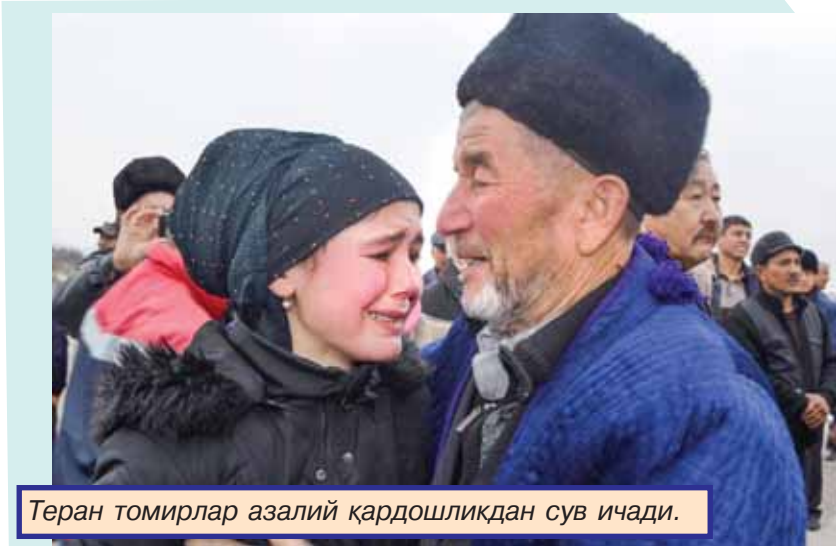
Теран томирлар азалий қардошлиқдан сув ичади.

Узоқ йиллар мамлакатимизда истиқомат қилиб, жамият равангага муносиб ҳисса қўшиб келаётган ва биз билан ватандош бўлишни орзу қилган 2 минг 528 нафар шахс Ўзбекистон Республикаси фуқаролигига қабул қилинди.