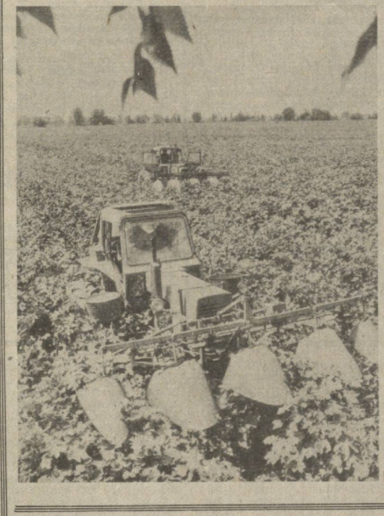
ЯШИЛ КОНВЕЙЕРЛАРГА КЕНГ ЙЎЛ