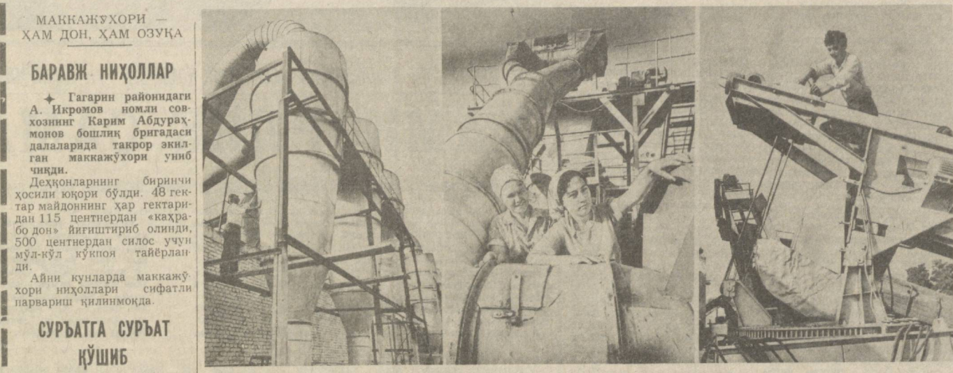
Республикамиз пахта тозалаш саноати корхоналари 1983 йил ҳосилини қабул қилиш ва қайта ишлашга катта ҳўсботлик кўрмоқда. Сиз қўриб турган фотосуратлар Янгийўл пахта тозалаш заводи цехларидаги қизгин меҳнат лаҳзаларида ҳўсбот қилинди. Суратларда: (чапдан) 1. Линтер цехи