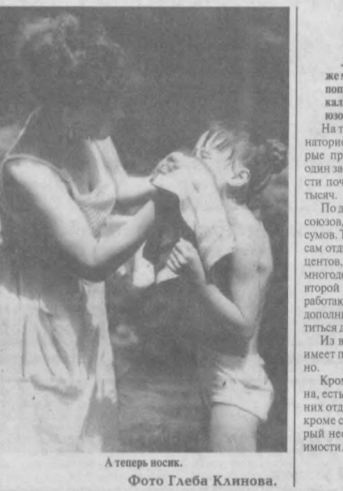
А теперь поспок.

Ни на один день не умолкают веселые голоса, песни, смех детей в детско-оздоровительном лагере "Мехржон" системы Узбекистана, расположенном на берегу Ташкентского моря.