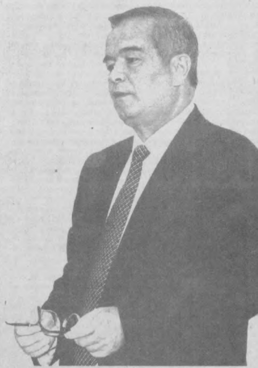
Ислам Каримов, премьер-министр Республики Узбекистан, председатель Жогарты Кенгеса Республики Каракалпакстан, хокимы областей и города Ташкента, руководители министерств, комитетов, ассоциаций, концернов, корпораций, учреждений и организаций.