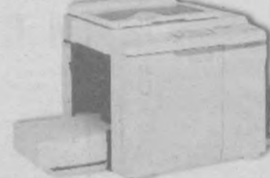
RISOGRAPH GR 3750