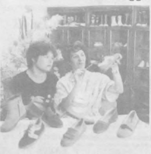
Коллектив Янгйольского акционерного общества "Кичинот" освоил новую технологию по пошиву детской обуви совместно с австрийской фирмой "Bega".

Эти корни состоят из государственных деятелей, творческих работников и ученых. Думаю, нет необходимости говорить о той части корней, которую составляют его нынешние побегы.