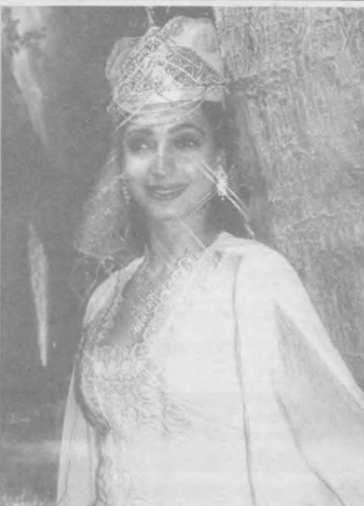
Крупным планом ТЕРПСИХОРА ИЛИ ФЕМИДА?