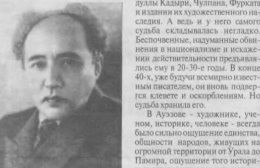
Фотопортрет писателя Мухтара Ауэзова.