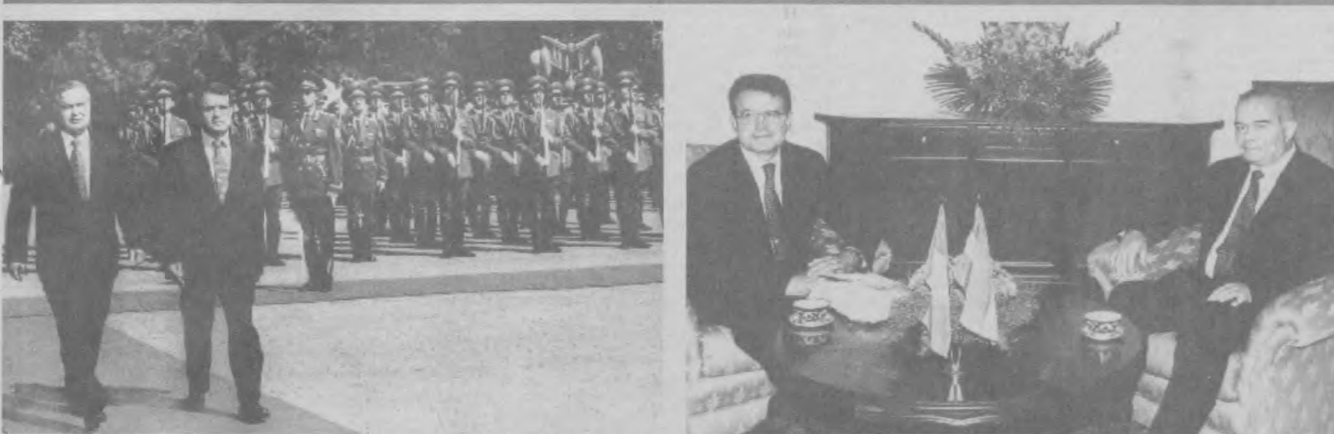
УЗБЕКИСТАН - ИТАЛИЯ: