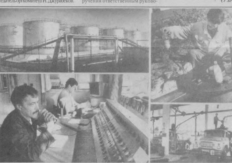
На Чинабадскую нефтебазу уже поступает топливо нового Караул-базарского нефтеперерабатывающего завода.