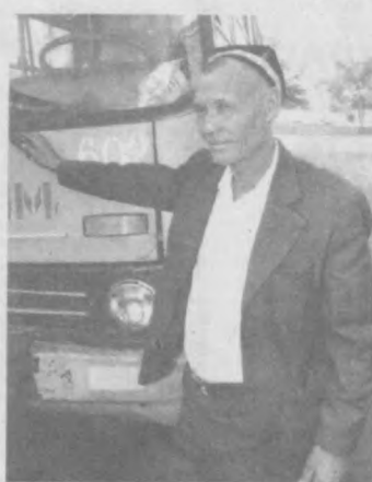
когда работал на маршрутах седьмом и двенадцатым, сорок восьмым и двадцать первым...