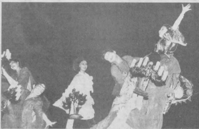
Коллектив русского молодежного театра начал нынешний сезон премьерой "Девочки со слепыми". Этот спектакль - мимический, и артисты без слов постарались донести содержание сказки до зрителей.