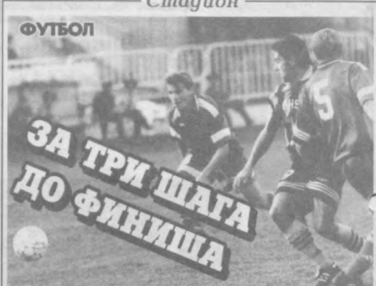
Чемпионат Узбекистана. Высшая лига. XXXI тур. "Насаф" - "Анжлян" - 3:0, "Зарафшан" - "Согдиана" - 1:1, "Дустлик" - "Афросиаб" - 2:3, "Атласчи" - "Нефтчи" - 2:5, "Касансай" - "Бухара" - 3:2, "Трактор" - "Сурхан" - 3:1, "Пахтакор" - "Чиланзар" - 5:0, "Хорезм" - МХСК - 2:4, "Навбахор" - "Янгир" - 3:0.