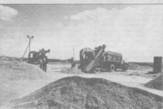
Земледельцы Хорезма наращивают темпы уборочной. Среди них и труженники Янгиаркского района. Дехкане общественного хозяйства имени Шарафа Рашидова этого района борются за 30-центнерный урожай хлопка-сырца и 40-центнерный урожай риса.